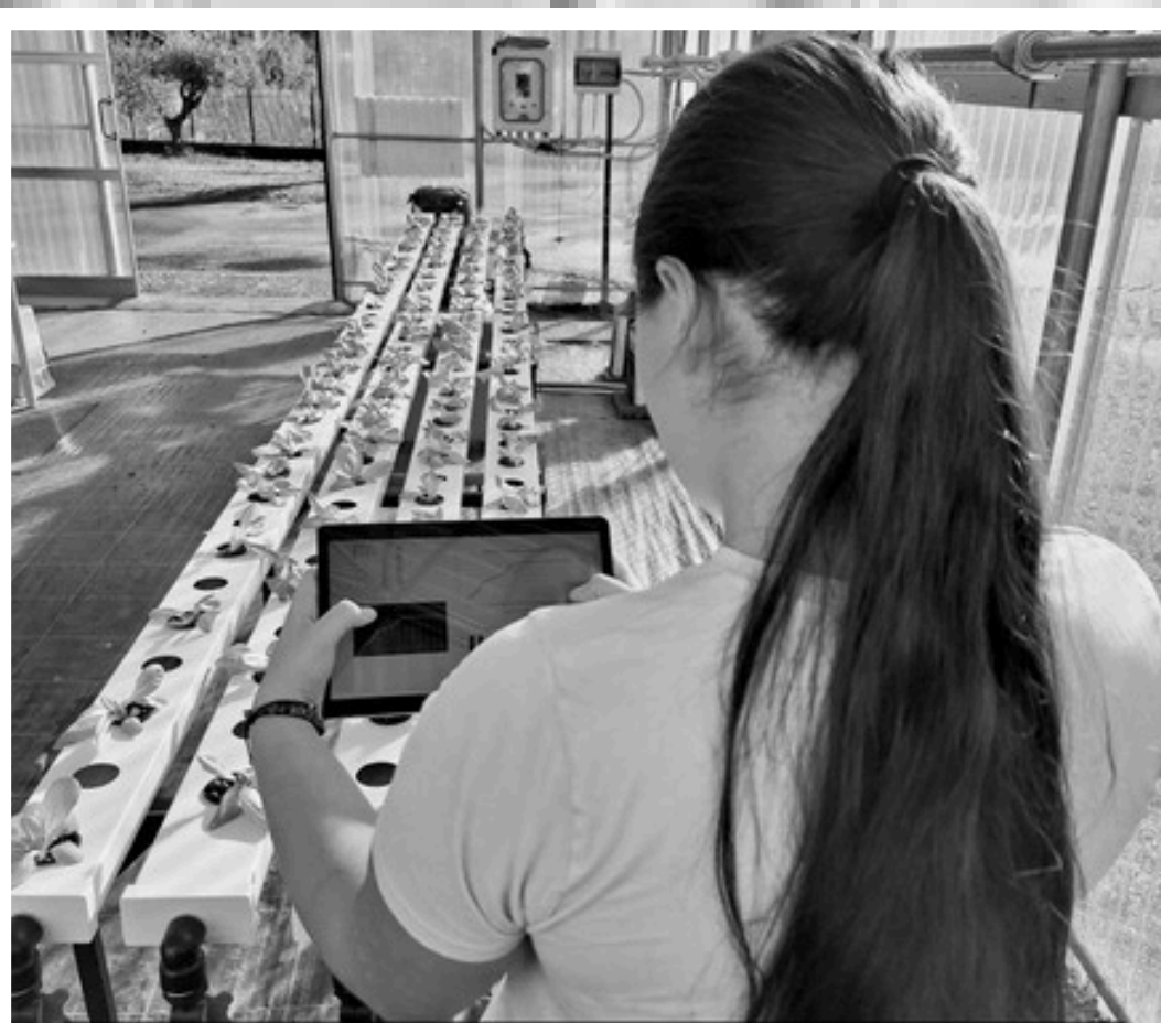
Donna, ponte tra Innovazione e Tradizione